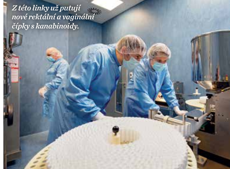
Z této linky už putují nové rektální a vaginální čípky s kanabinoidy.